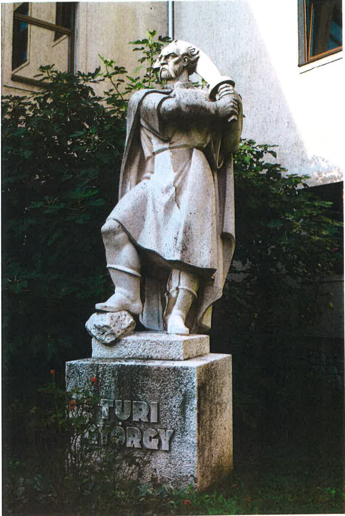
Ohmann Béla: Turi György c. mészkőszobra.