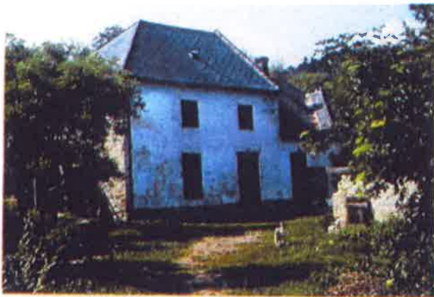
1. kép Plul-malom