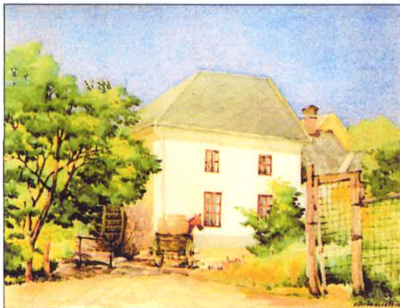
3. kép. Köllöd András akvarellje a Plul-malomról