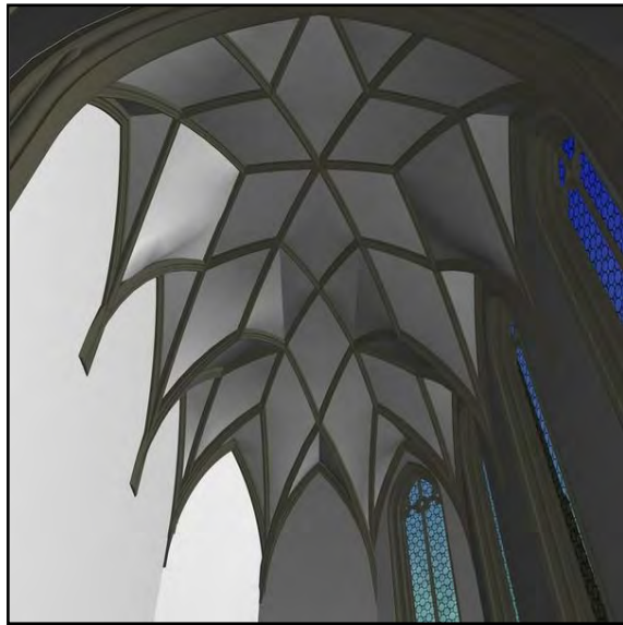
Pálos kolostor rekonstrukciós képei